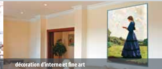
décoration d'intérieur et fine art