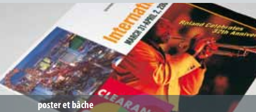
poster et bache