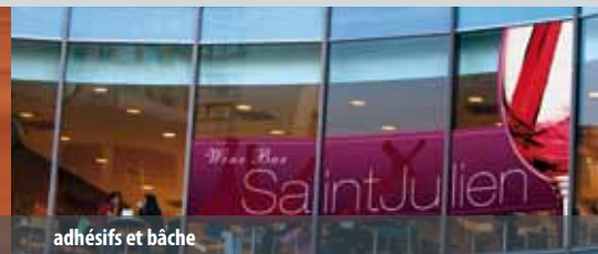
adhésifs et bâche