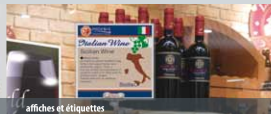
affiches et étiquettes