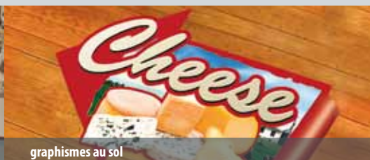
graphismes au sol