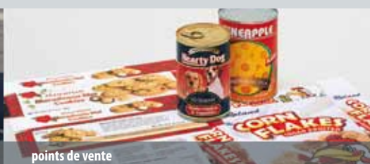
points de vente