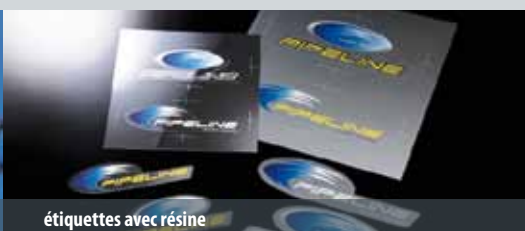
étiquettes avec résine