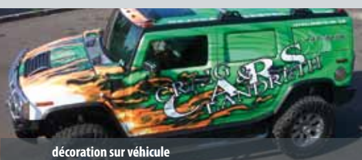
décoration sur véhicule