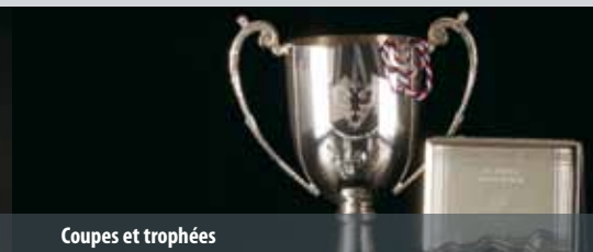
Coupes et trophées