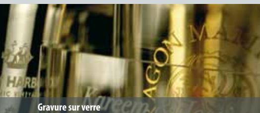
Gravure sur verre