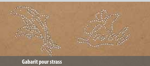
Gabarit pour strass