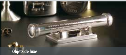
Objets de luxe