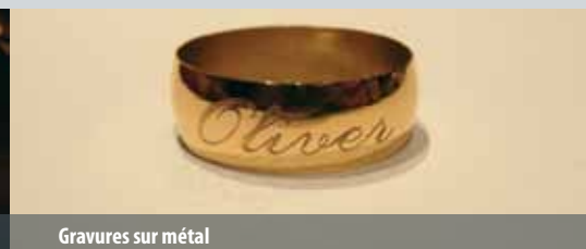
Gravures sur métal