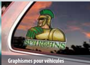
Graphismes pour véhicules