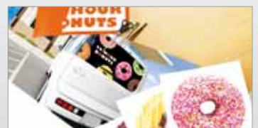
Solutions pour la créativité.