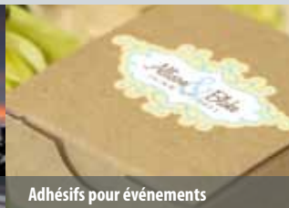
Adhésifs pour événements