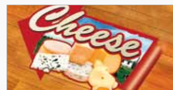
Graphismes au sol.

L'utilisateur peut donc offrir des solutions uniques grâce à la fonction de découpe intégrée, ainsi qu'à l'utilisation de l'encre métallique, qui lui permet de donner une valeur ajoutée aux solutions classiques.