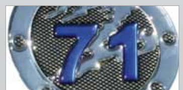
Doming sur étiquettes imprimées.