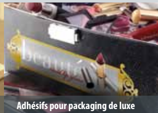
Adhésifs pour packaging de luxe