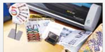
Personnalisation d'accessoires et gadgets.