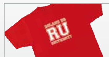
T-shirt avec thermo-transfert.